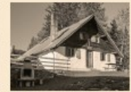
106 Eichenwieser Schwamm