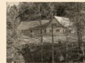
108 Kiessner Schwamm