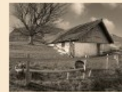
102 Holzholder Kienberg