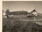
101 Oberrieter Kienberg