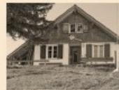
107 Diepoldsauer Schwamm