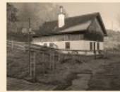
104 Oberrieter Strüssler