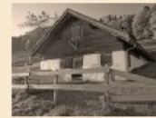
105 Holzholder Strüssler