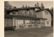
109 Montlinger Schwamm

Herzlichen Dank: Ortsgemeinde Oberriet · Rhode Kienberg Holzrhode Ortsgemeinde Montlingen · Ortsgemeinde Holzrhode · Ortsgemeinde Kiessern Ortsgemeinde Eichenwies · Ortsgemeinde Diepoldsau www.oberriet.ch/ortsgemeinden