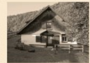
103 Montlinger Kienberg